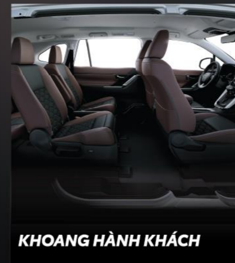
KHOANG HÀNH KHÁCH

Ghế lái chỉnh điện 8 hướng giúp linh hoạt chỉnh vị trí ngồi phù hợp với cơ thể, tiện lợi khi sử dụng, tránh căng thẳng khi ngồi trong thời gian dài.