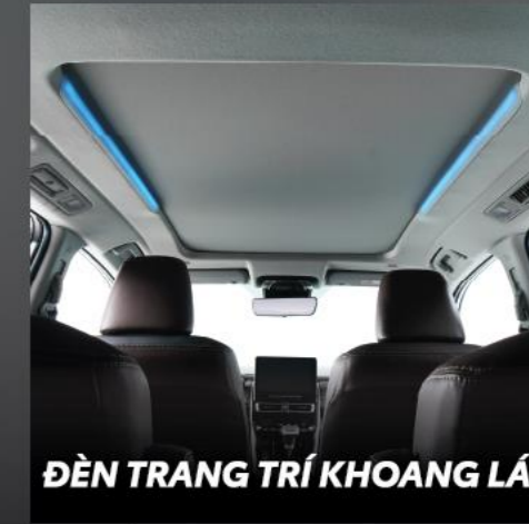
ĐÈN TRANG TRÍ KHOANG LÁI

Tạo không gian mở cho hành khách được hòa mình với thiên nhiên trong mỗi chuyến đi.