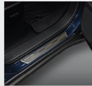
Ốp bậc lên xuống