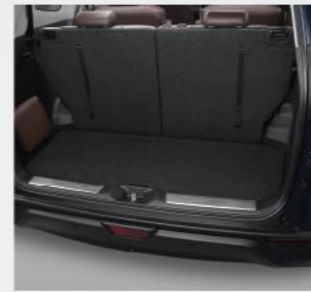
Ốp chống trầy cốp sau