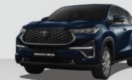
Xanh ánh đen 1H2