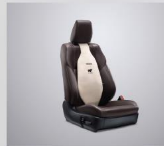
Tựa lưng ghế