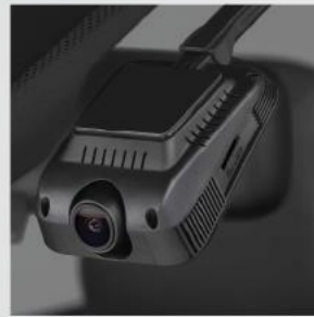
Camera hành trình trước