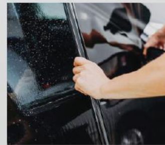
Phim dán kính