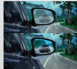
Phim dán chống nước kính chiếu hậu ngoài