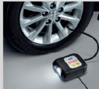
Bơm lốp điện tử