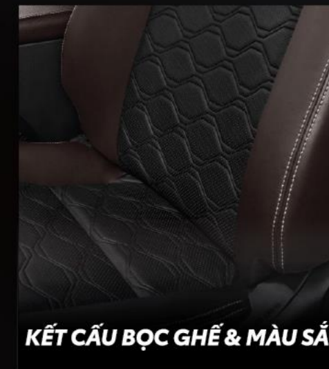
KẾT CẤU BỌC GHẾ & MÀU SẮC

Khoang hành lý rộng rãi hàng đầu phân khúc với thiết kế linh hoạt và tiện dụng, giúp dễ dàng điều chỉnh không gian theo ý muốn.