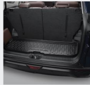
Khay hành lý