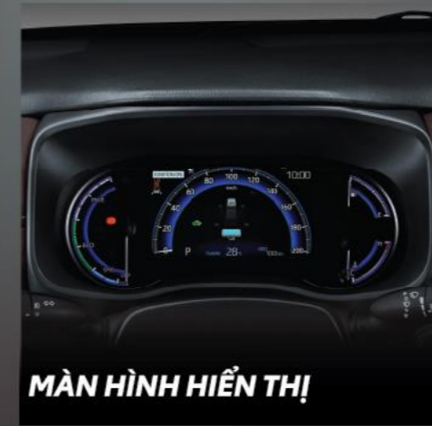
MÀN HÌNH HIỂN THỊ

Vô lăng được thiết kế 3 chấu bọc da, mạ bạc cao cấp tích hợp các nút bấm tiện lợi cho thao tác mượt mà hơn.