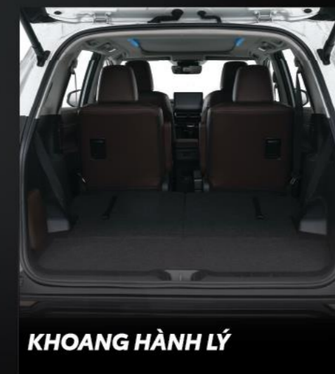
KHOANG HÀNH LÝ

Khoảng cách hai hàng ghế rộng rãi kết hợp với mặt sàn phẳng giúp hành khách thoải mái và thư giãn trong những chuyến đi xa.