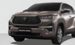
Nâu đồng 4V8