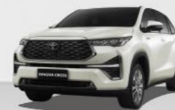
Trắng ngọc trai 089