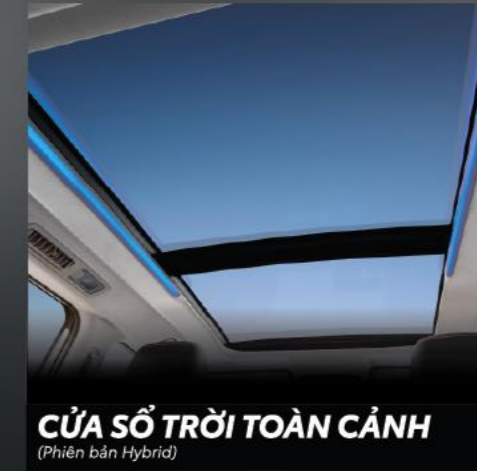
CỬA SỔ TRỜI TOÀN CẢNH (Phiên bản Hybrid)

Thiết kế màn hình với chế độ hiển thị trực quan, rõ nét các thông số cần thiết hỗ trợ người lái vận hành trơn tru.